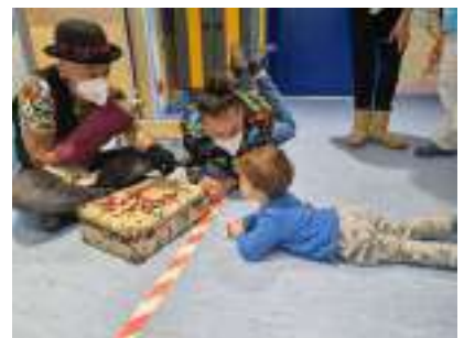
Mago Flop e Mago Pongo