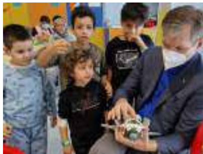
L'astronauta Paolo Nespoli