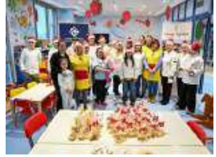
Merenda CFP e Ass. Cuochi